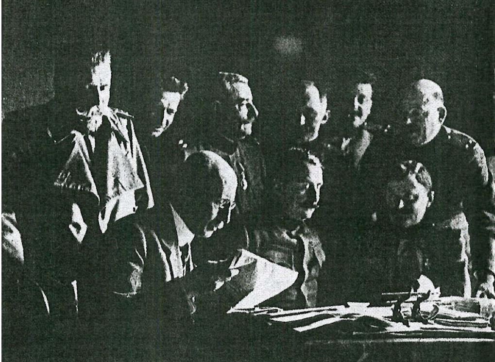
Mayıs 1903 Komplocuları-Birlik ya da Ölüm Merkezî Yürütme Komitesi'ni oluşturdukları 1911 tarihli fotoğraf