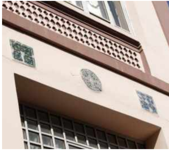
Res. 20. Tekirdağ Eski Vali Konağı, doğu cephe Kütahya üretimi çiniler (Fot. S. Altier 2017)