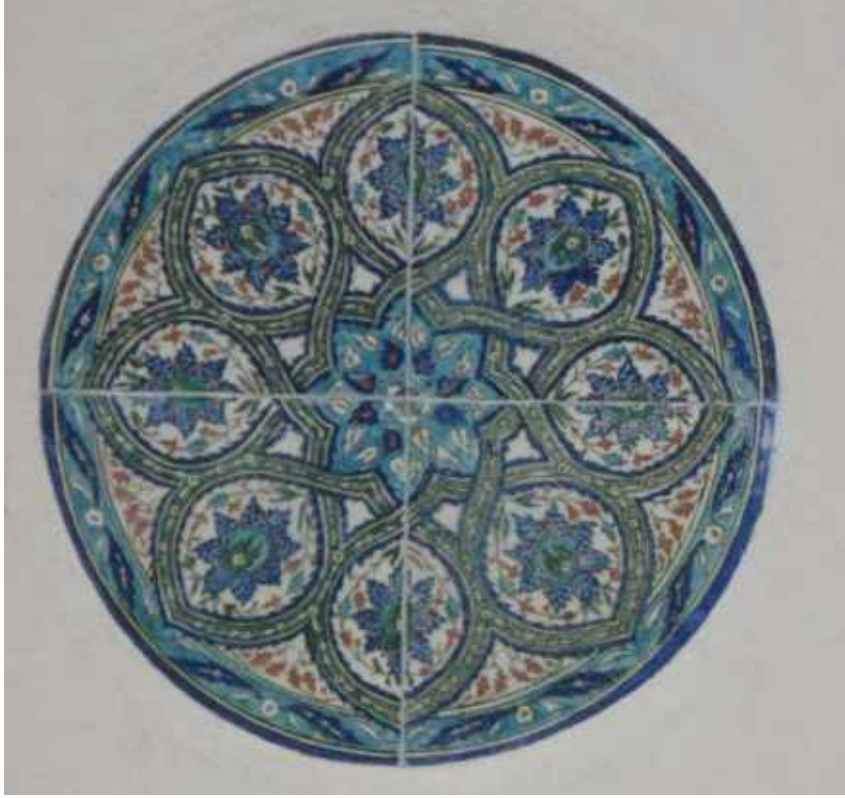
Res. 14. Tekirdağ Eski Vali Konağı, ana kapının iki yanındaki Kütahya çinisi madalyon