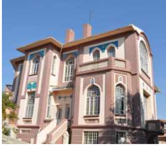
Res. 10. Tekirdağ Eski Vali Konağı, güney cephe