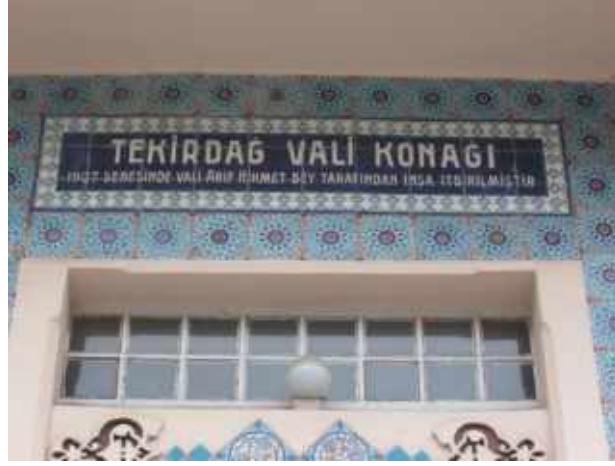
Res. 3. Tekirdağ Eski Vali Konağı, Ana giriş kapısı üzerinde inşa kitabesi