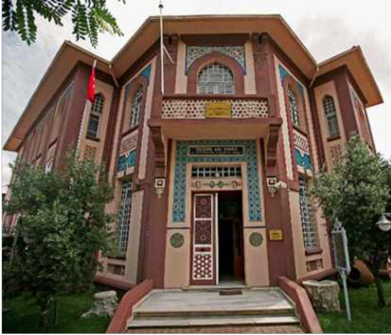
Res. 1. Tekirdağ Eski Vali Konağı, Barbaros Caddesi'ne bakan ana giriş