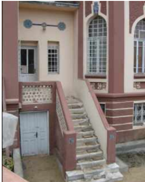
Res. 21. Tekirdağ Eski Vali Konağı, güney cephe Kütahya üretimi çini panolar ve taş süslemeler