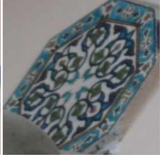
Res 23a. b. Tekirdağ Eski Vali Konağı, güney cephe kapı üzerindeki Kütahya üretimi sekizgen çini panolar