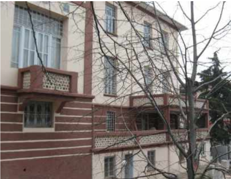
Res. 8. Tekirdağ Eski Vali Konağı, doğu cephe