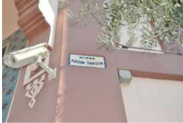
Res. 4. Tekirdağ Eski Vali Konağı, mimar kitabesi