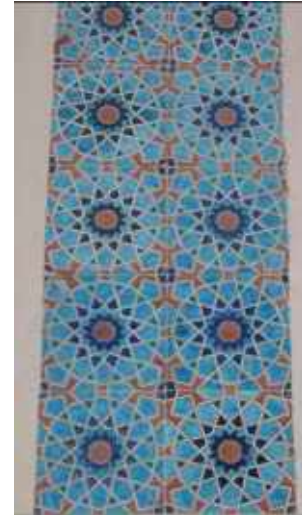
Res. 17a-b. Tekirdağ Eski Vali Konağı, Ana kapıyı dışarıdan kuşatan Kütahya üretimi çiniler