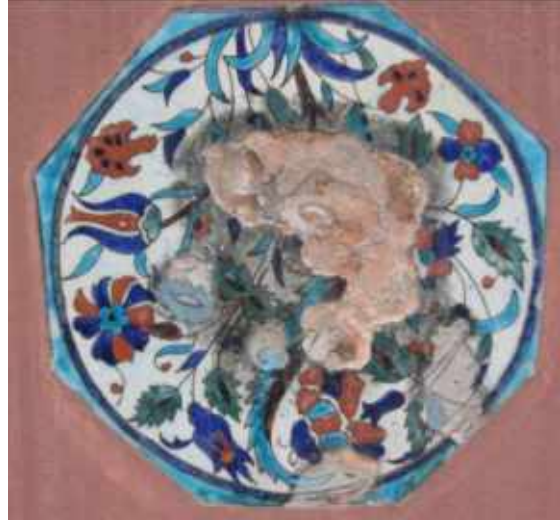
Res 22a. b. Tekirdağ Eski Vali Konağı, güney cephe merdiven başlangıcındaki Kütahya üretimi sekizgen çini panolar