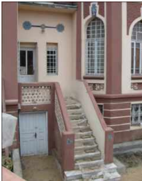
Res. 11. Tekirdağ Eski Vali Konağı, güney cephe kapıları