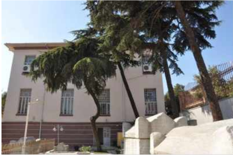
Res. 7. Tekirdağ Eski Vali Konağı, kuzey cephe