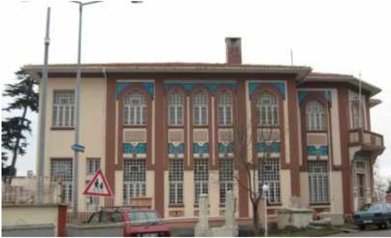
Res. 6. Tekirdağ Eski Vali Konağı, batı ve güney batı cephe