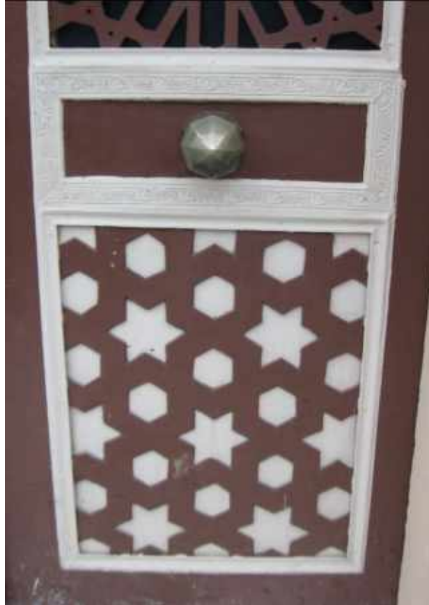
Res. 13. Tekirdağ Eski Vali Konağı, ana kapı süslemeleri