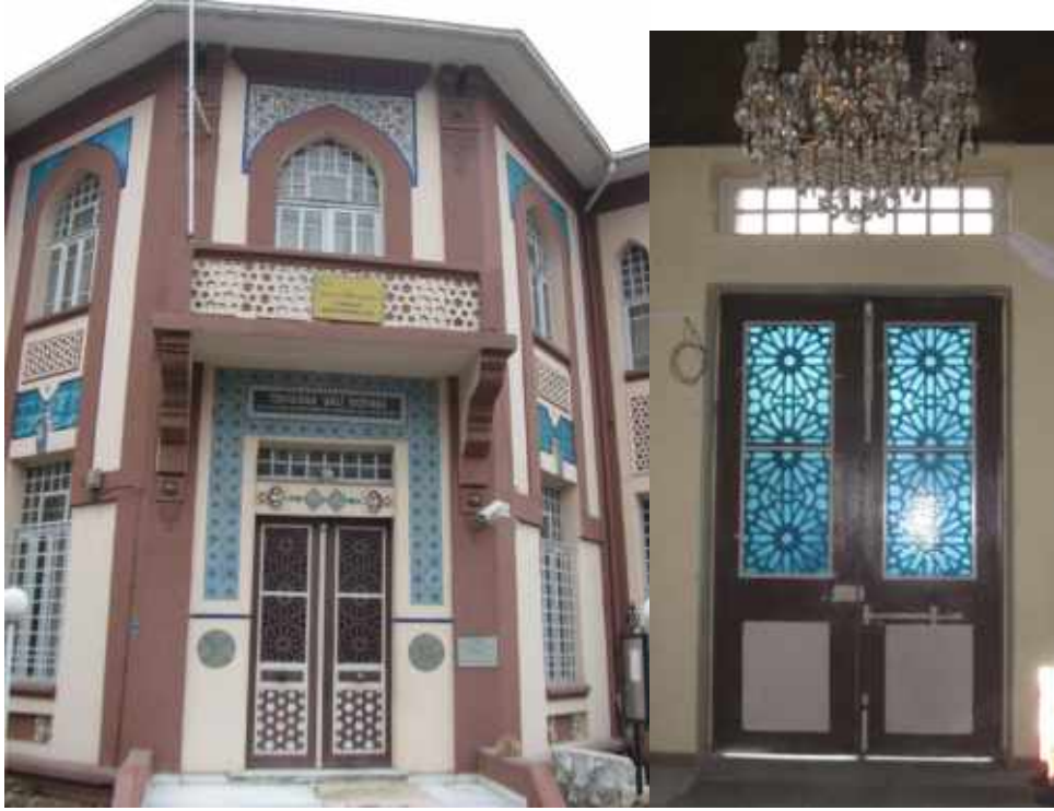
Res. 12a-b. Tekirdağ Eski Vali Konağı, ana kapı dış ve içten görünüm