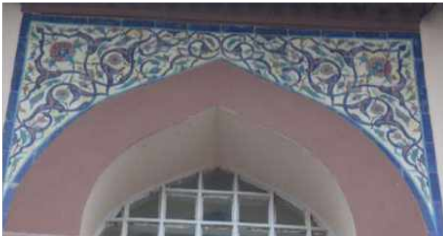
Res. 18. Tekirdağ Eski Vali Konağı, balkon kapısı kemer köşelerinde yer alan Kütahya üretimi çiniler