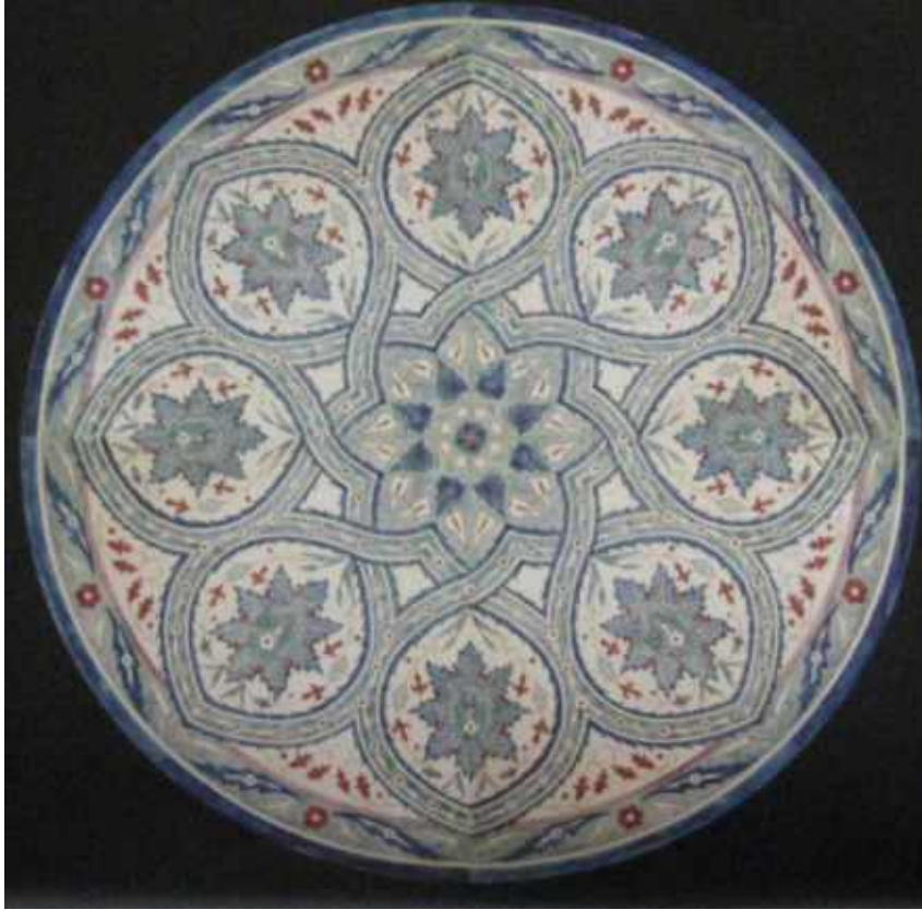
Res. 15. Stepan Vartanyan'a ait çini masa tasarımı (Garo Kürkman 2005, s. 2201).