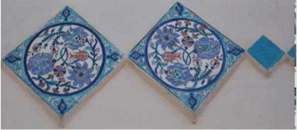
Res. 16. Tekirdağ Eski Vali Konağı, Ana Kapının üzerindeki Kütahya çini panolar (Fot. S. Altier 2017)