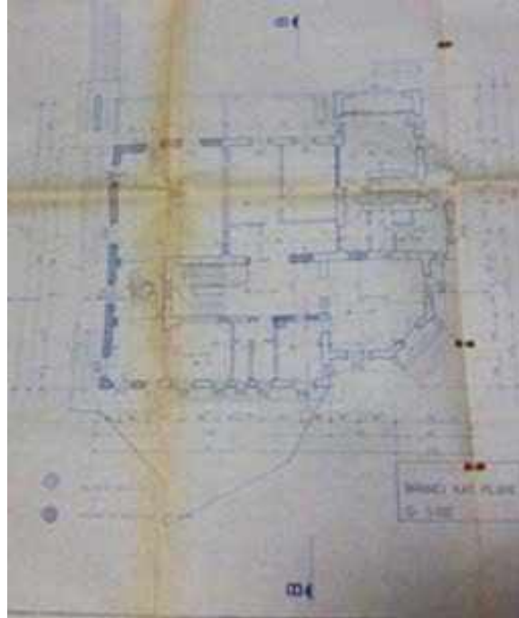
Res. 5. Tekirdağ Eski Vali Konağı, birinci kat planı