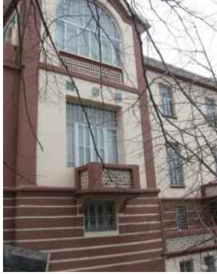
Res. 9. Tekirdağ Eski Vali Konağı, doğu cephe