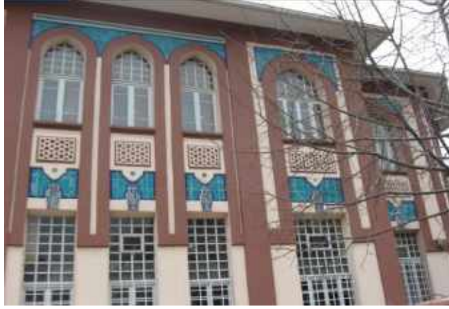
Res. 19. Tekirdağ Eski Vali Konağı, batı cephe Kütahya üretimi çiniler