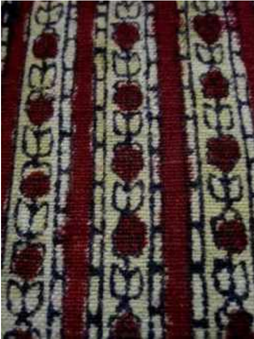
Resim 6: El bask s Çiçek motifi Bone kumaş , СИАМЗ КП 347