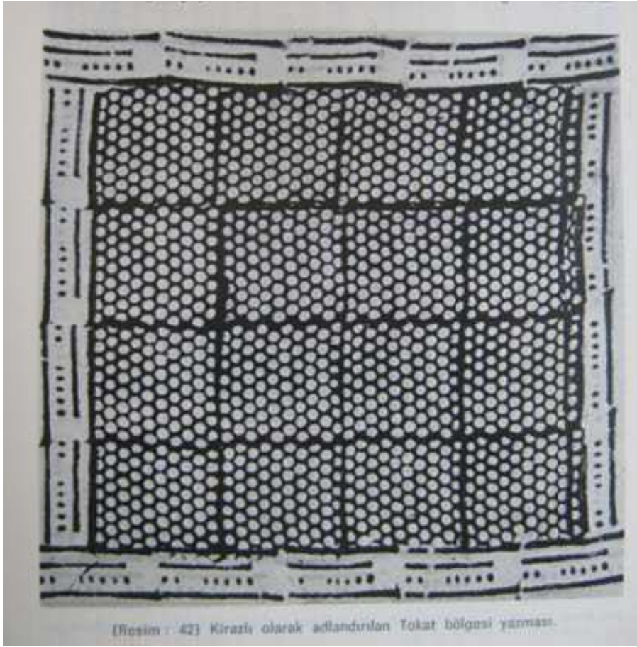
Resim 16: Kirazlı olarak adlandırılan Tokat bölgesi Yazması