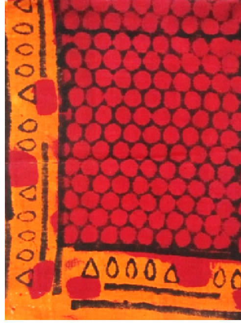
Resim 13: Kirazlı Tokat Yazması -Al n Bezi, Staroçerkask Müzesi Koleksiyonu Envanter No: AM3KII 3825/1