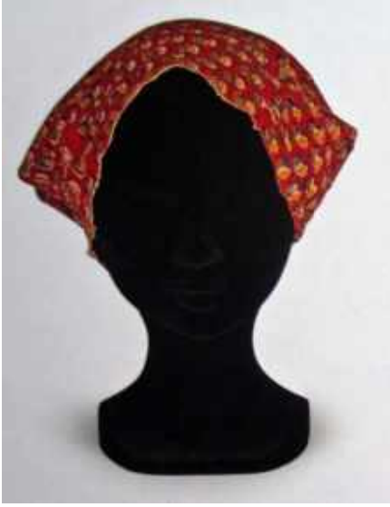
Resim 4: Bone (Şl çka), Envanter No: POMK КП 17299/1