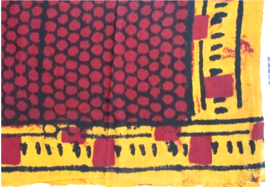
Resim 17: Kirazlı Tokat Yazması -Alın Bezi, Staroçerkask Müzesi Koleksiyonu Envanter No: CIAM3 3659/3