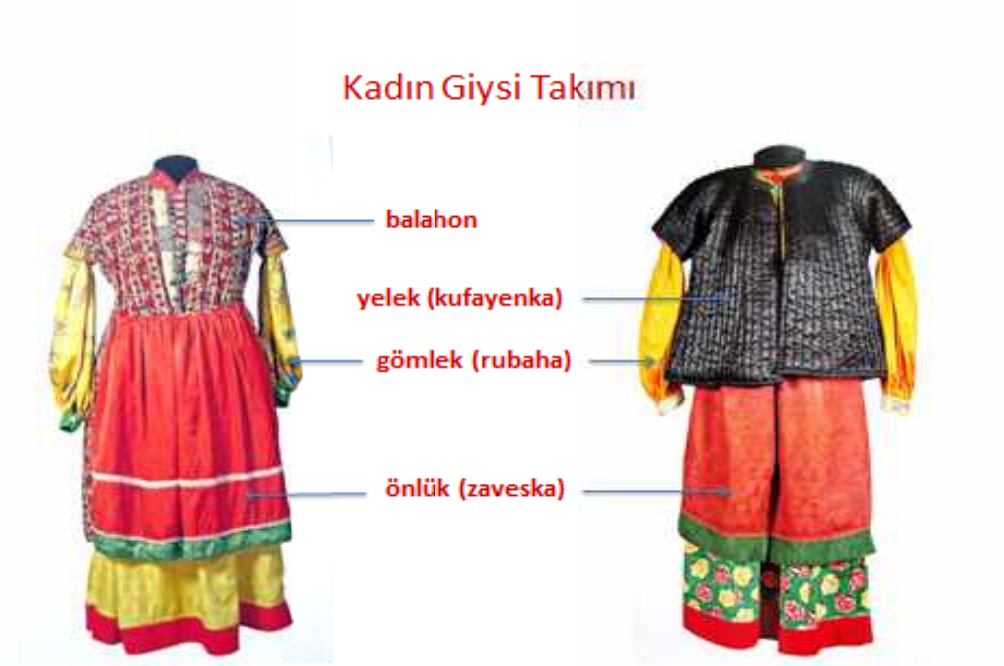
Resim 1: Nekrasov-Kazak Kadın Giysisi, 19. Yy. sonu-20. Yy. başlar , Envanter No: КП 2295/2, 386/1, 17301/2, 9767, 9768, 9761/3, 9786, Kaynak: (НародыДона... Ростов-на-Дону, 2005, с. 72, 74)