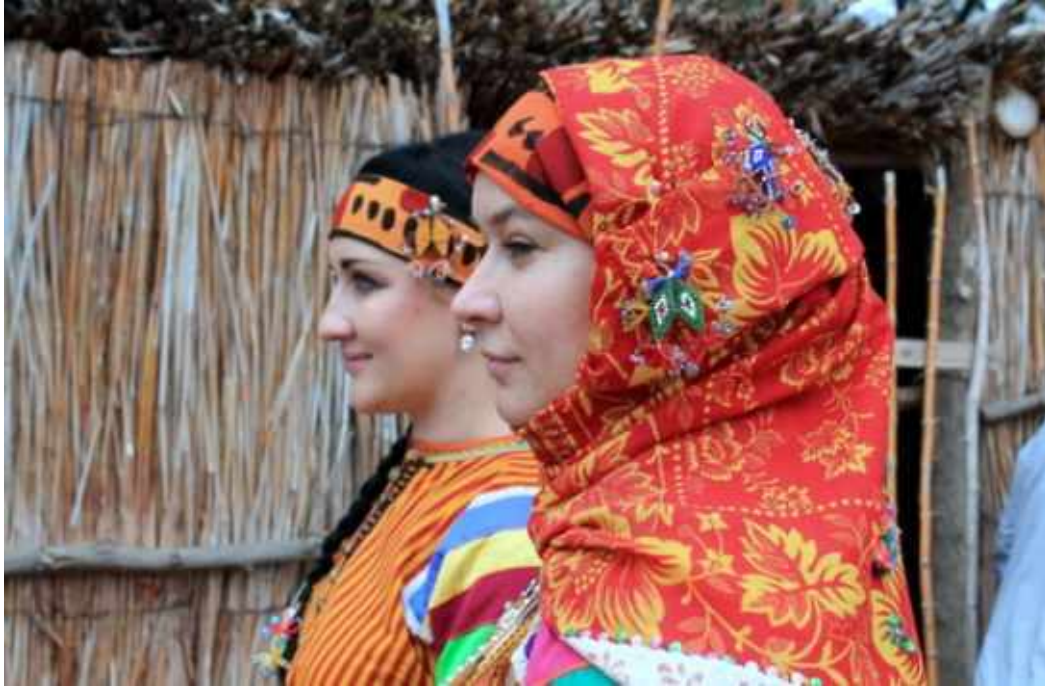
Resim 20: Günümüzde Rusya'da yaşayan Nekrasov Kazakları'nın giydikleri geleneksel Alın Bezi ve Eşarb gösteren bir fotoğraf