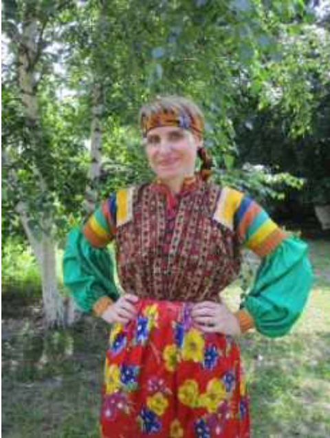
Resim 2: Nekrasov Kazak Kadın Giysi Takımı, Staroçerkask Müzesi Envanter No: СИАМЗ КП 1709/2