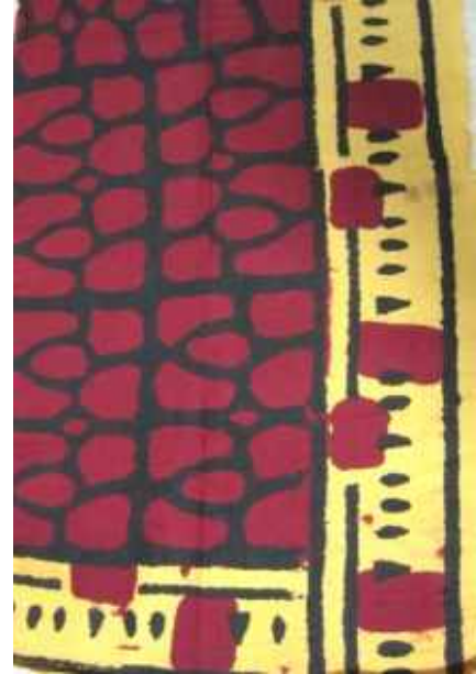
Resim 15: Tokat Yarımlı Elmalı Yazması -Al n Bezi, Staroçerkask Müzesi Koleksiyonu Envanter No: СИАМЗКП 4231