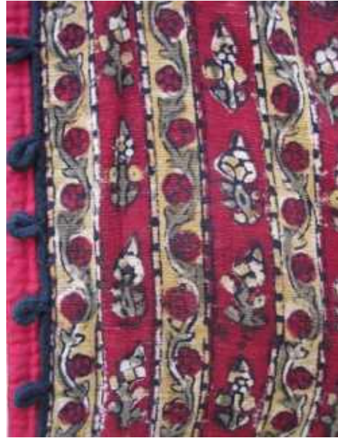
Resim 3: Balahon dikiminde kullanılan el baskısı kumaş. Staroçerkask Müzesi Envanter No: СИАМЗ КП 1709/2