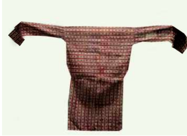
Resim 5: Bone (Şl çka), Staroçerkask Müzesi Envanter No: СИАМЗКП 347