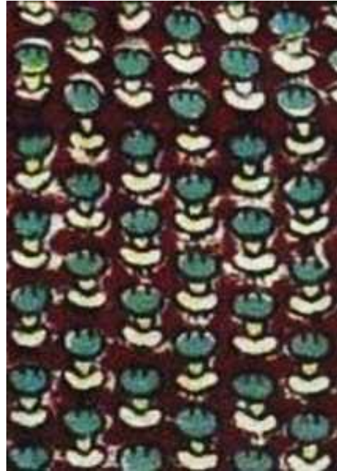
Resim 7: El bask s Ar motifi Bone kumaş , СИАМЗ КП 4228