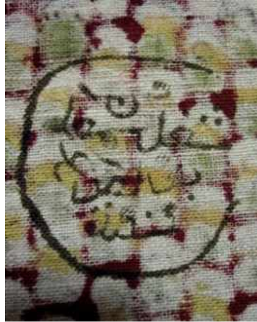
Resim 9: Osmanlıca bir üretici damgası (okunamamıştır) Staroçerkask Müzesi Koleksiyonu Envanter No: СИАМЗКП 3660/1