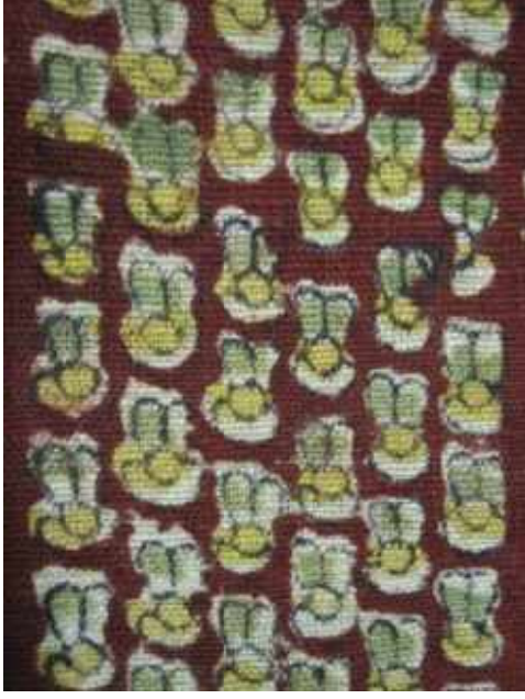
Resim 8: Ar desenli yazma Staroçerkask Müzesi Koleksiyonu Envanter No: СИАМЗКП 3660/1