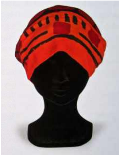
Resim 10: Alın Bezi. Envanter No: POMKKП 9329