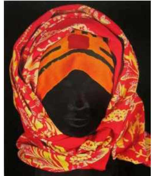
Resim 11: Alın Bezi üzerine sarı İlan Uruminskiy isimli Eşarp. Envanter No: POMKKП 9762