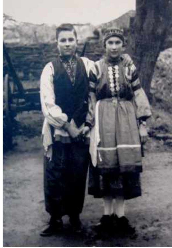
Resim 19: Geleceğin Ailesi isimli bir fotoğraf. Türkiye 1950, (Straçerkask Müzesi Koleksiyonu)