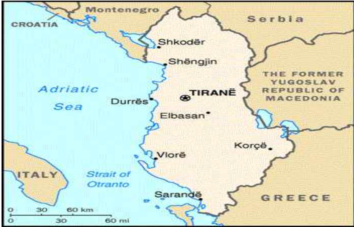
Harita 1: Arnavutluk Haritası

alınması, İslamlaşma faaliyetini artırdı. XV ve XVI. yüzyıllarda bu durumu Osmanlı kayıtlarından görmek mümkündür. 6 Evliya Çelebi'nin kaydına göre, Avlonya, bahçeler, bağlar, kestane, zeytin, incir, limon ağaçları ile çevrili birçok mahalleye bölünmüştü. Her birinde cami bulunan Hünkâr Camii, Mumcuza'de, Tabaklar, Hüseyin Ağa, Mahkeme, Çarşı mahalleleri vardı. Kanuni Sultan Süleyman Camii kubbeli ve üzeri kurşun kaplıydı. Şehirde bedesten yoktu. 7 1690'daki geçici Venedik işgalinden sonra Avlonya, XVIII. yüzyılda gittikçe geriledi. 8 1888-89 tarihli Yanya Vilâyeti Salnâmesi'ne göre Avlonya'da 490 ev ve 9 han vardı. Avlonya kazası ise 22.577 Müslüman, 3.316 Hristiyan-Ortodoks nüfusa sahipti. Bu rakamlar yerli nüfusun hemen hemen tamamıyla İslamlaştığını gösterir. Balkan Savaşı sırasında Arnavut milliyetçilerinin üssü olan Avlonya, I. Dünya Savaşı'na kadar Arnavutluk'un merkezi oldu. II. Dünya Savaşı'nda şehir geçici bir süre için tekrar yabancı işgaline uğradı ise de kısa süre içinde büyük bir gelişme gösterdi. 9