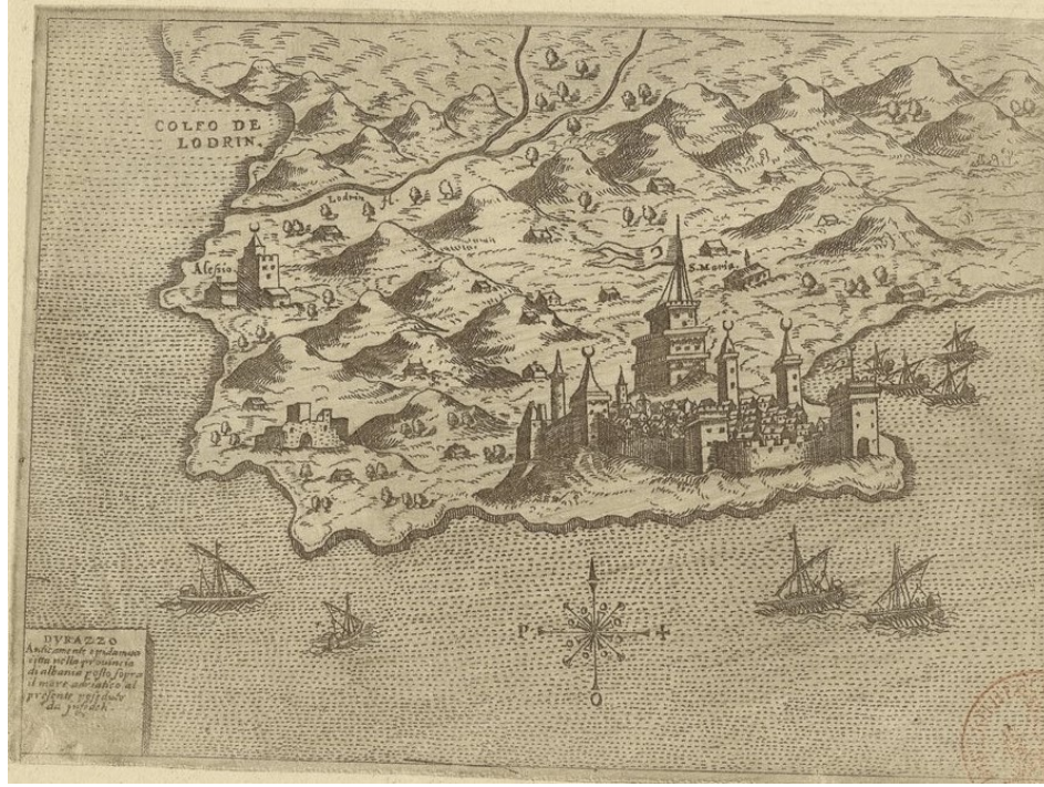
Resim 2. 1563'te Draç 53