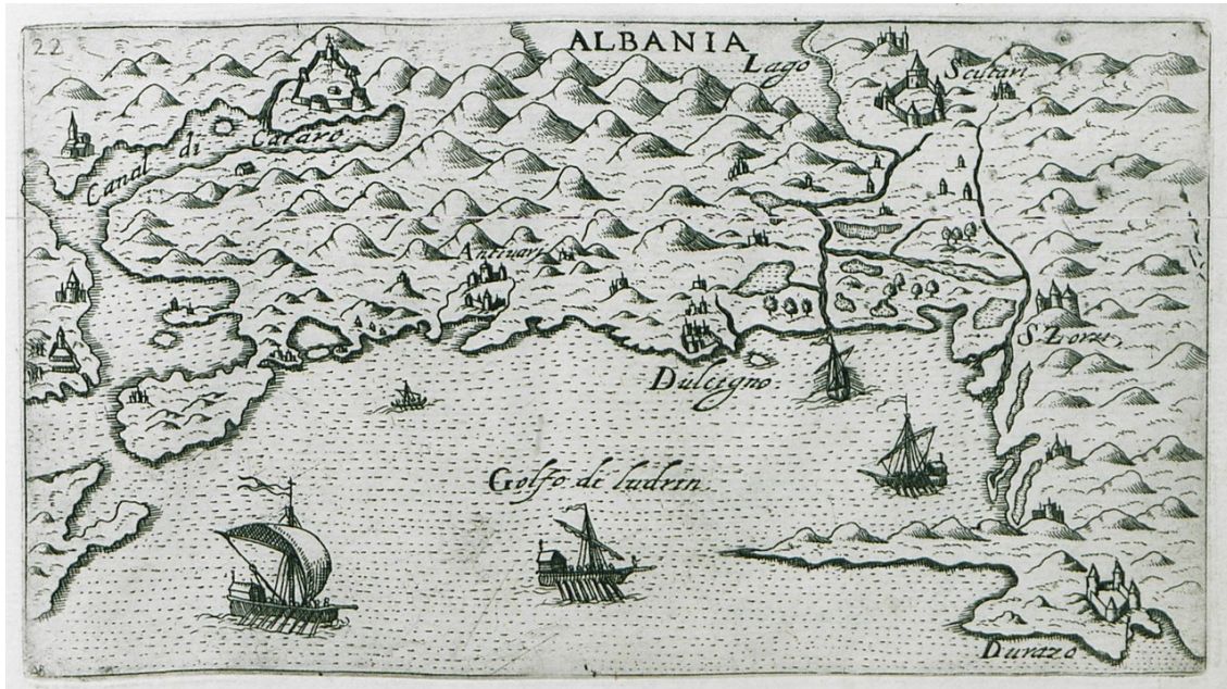
Resim 3. 1598'de Draç 54