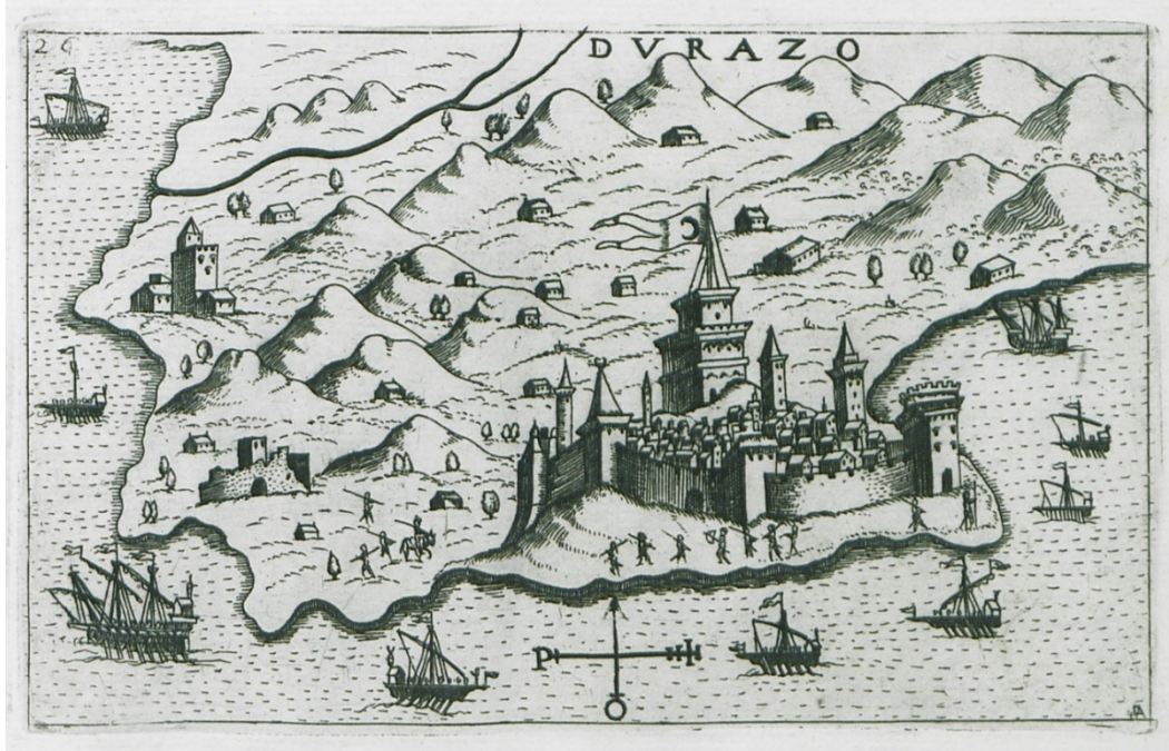
Resim 4: 1598'de Draç ve Çevresi 57

Daha fihristte göze çarpan pazar yerine dair kayıt ( bac-ı bazar ) da buranın kale dışında ayrı bir mekân olarak düşünülmesi gerekliliğini ortaya koymaktadır. Kaldı ki bu kısmın başında sunulan belgede de duruma dair bir şikâyet net bir şekilde görülmektedir. Bunun dışında gümrük ve iskele bölgeleri de yine Draç'ın liman şehir özelliğinin net bir yansıması olarak görülebilir. Bu hâli şehrin her özelliği ile müstesna bir merkez olmakla birlikte düzen itibarıyla da bir Osmanlı şehri hâline geldiği gerçeğini net bir şekilde ortaya koyar.