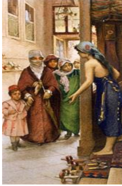
Fausto Zonaro, Buyrun 10