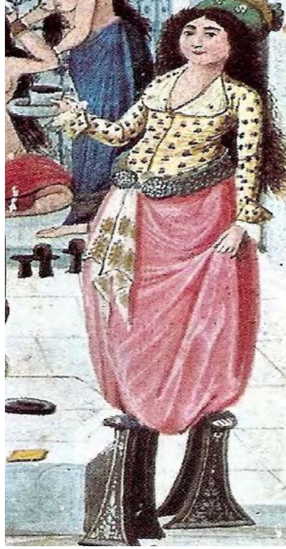
Hamamda müşterilere kahve ikram eden kadın 73