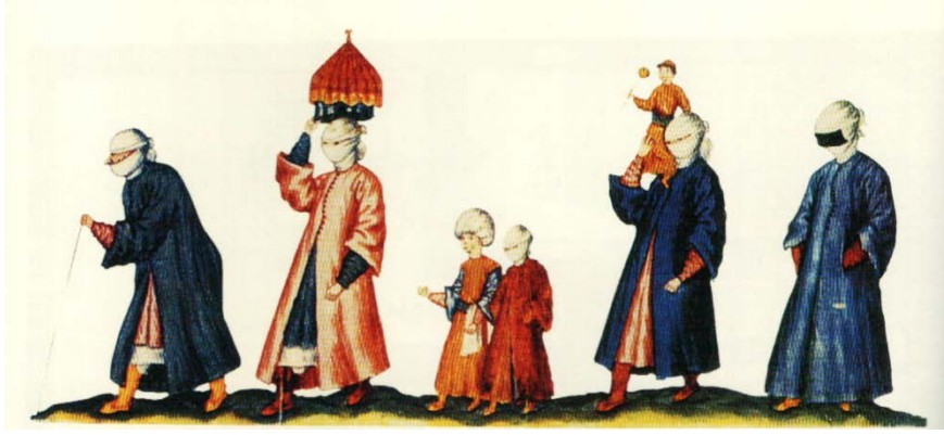
Hamama giden kadınlar ve çocuklar 70