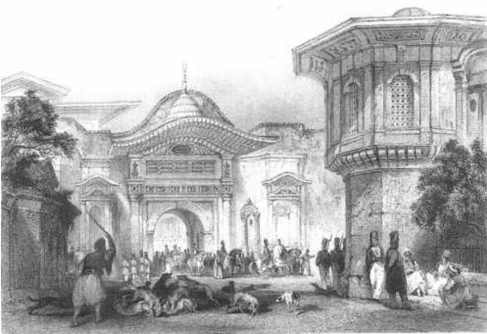
Resim 2: Bab-ı Ali ve Alay Köşkü (Kaynak: R. Walsh. ve T. Allom. (1839). Constantinople and the Scenery of the Seven Churches of Asia Minor . Londra: Fisher & Son Company, 2. Cilt, s. 66-67)