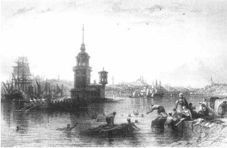
Resim 3: Kız Kulesi (Kaynak: R. Walsh. ve T. Allom. (1839). Constantinople and the Scenery of the Seven Churches of Asia Minor . Londra: Fisher & Son Company, 1. Cilt s. 82-83)