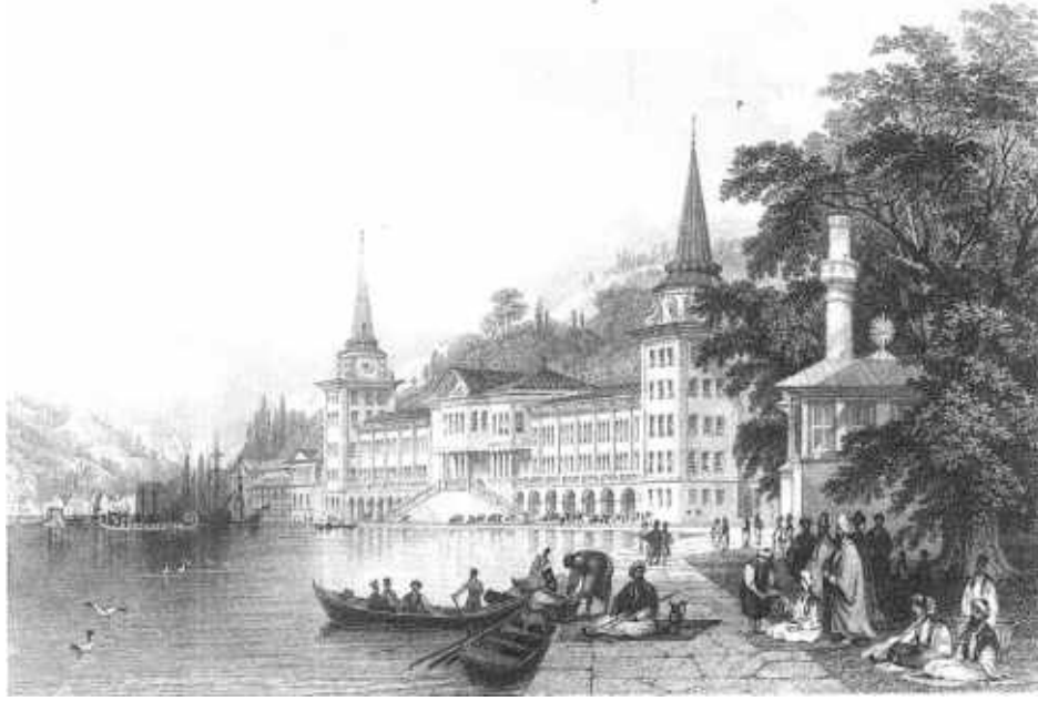
Resim 5: Çengelköy’de süvari Kışlası (Kaynak: R. Walsh. ve T. Allom. (1839). Constantinople and the Scenery of the Seven Churches of Asia Minor . Londra: Fisher & Son Company, 2. Cilt, s. 64-65)

Mimarlığı ve ressamlığı dışında, Allom’un yaptığı panorama sergileri 28 de oldukça önemli bir yere sahiptir. Temmuz 1850’de, Regent Street Polytechnic bitişiğindeki Exhibition Theatre’da Osmanlı topraklarında yaptığı çizimlerini kullandığı panorama sergisini -üçüncü kez- açmıştır. 29 Serginin tanıtımı için yazdığı Polyorama ’nın girişinde “hareketli panorama”larda bilgiyi eğlence yoluyla aktarma yönteminin, dönemin sanatının yararlarına dair en geçerli alanlardan biri olduğunu aktarmıştır. 30 Dönem İngilteresinin panoramik sergilere ve özellikle İstanbul konusuna ilgisi düşünüldüğünde bu serginin ne kadar rağbet gördüğünü tahmin etmek mümkündür. Öyle ki 1850’de üçüncü kez sergilendiğini bildiğimiz bu panorama 1854’te Egyptian Hall’da dördüncü kez sergilenmiştir. 31 Dört serginin tamamının nerede düzenlendiği bilinmese de Polyorama ’nın metninden anlaşıldığı üzere hareketli bir panorama olduğu; yine Polyorama broşürünün de hem şematik hem de retorik açıdan özenli, eserlerin sergilenme sırasına göre tanıtımlarını içeren metinlerinde de hitabetin güçlü olduğu söylenebilir. 32